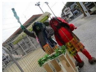
明日はみんなで力を合わせて 頑張れよ~(去年の鬼です)