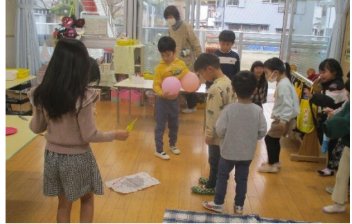
見つけた! (やっと気づいた...)