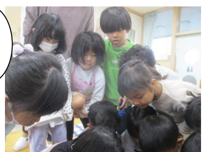
肩を抱き、大丈夫と励ます兄貴やえずき出すお友達も。手紙を読み、自分を顧みる① 明鏡止水の心境?