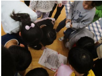
自分を顧みる② 「我が心に一点の曇り…なし?」