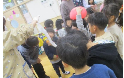
恐る恐る読むぶどう組は卒園がかかっています。