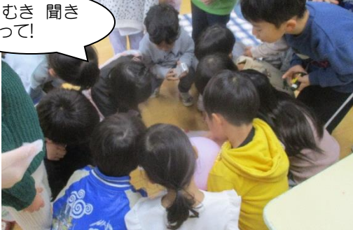
スラスラ読むお友達。「くもん、いくもん」効果。