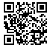
ホームページにも 掲載中です!見て下さいね

「鬼さんが保育園の落成式に人間に化けてお餅を拾いに来ちゃって、ほんでそのお餅をもって今日来たがよえ」という物凄い推理をしていたぶどう組のお友達がいました。そう、鬼さんも新園舎になって嬉しかったのでしょ!! みんなの悪い鬼を追い出して、心も体も健康でおりこの子ども達になりました(笑)