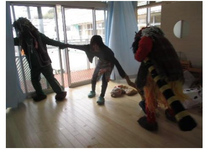
毎度お約束。きゃーっ先生が 鬼に捕まった!!!