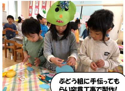
ぶどう組に手伝っても らい突貫工事で製作!