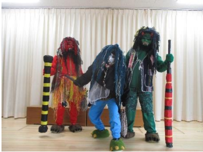
4年ぶりに白鬼が登場! (いや、鬼じゃないし…)

土曜日の生活発表会の余韻に浸る間もなく節分を迎えました。子ども達にはちょっぴり可哀想でしたがこの日を超えないと春が来ないので(そしてぶどう組は卒園がかかっているので🍇)来て頂きました。