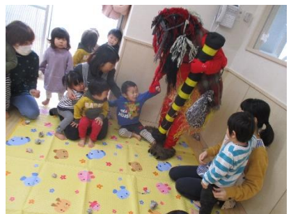
りんご組の部屋を内覧した後 子ども達に猛烈アピール。