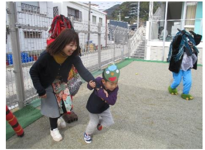
なんと!先生を助け出した勇者は めろん組のお友達というオチ!!