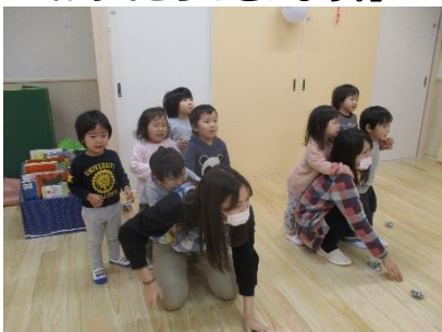
ばななのお友達はどうか? 先生の背中に親亀子亀孫亀状態!