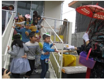
そこへお福さんが登場!! みんなで金の豆を投げて追い出そう!