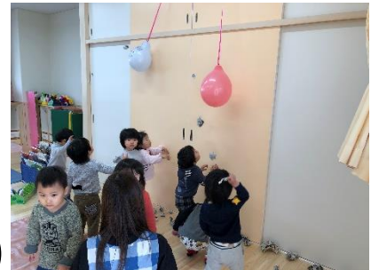
ばななは風船を鬼に見立て豆まきのシュ ミレーション中。鬼退治に余念なし!!