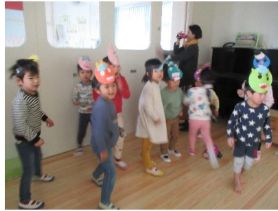
めろん組は最初から「おりこにします♪」 の大合唱。心に何かやましい事でも…。