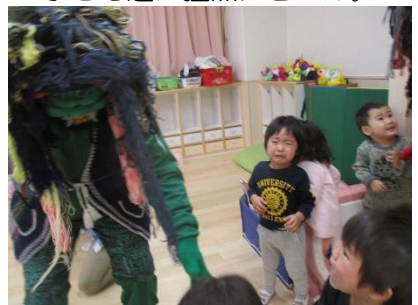
上から見下ろされたら そりゃあ怖いでしょうよ…。