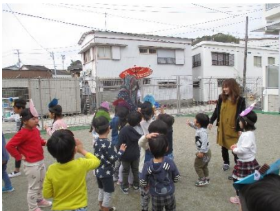
腕に落ちない表情の担任そっちのけ で頭をなででもらって満足気。