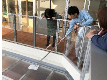
落成式の時に投げた祝い餅が! 突如空から「祝い餅」と紙切れが降っ てきた。(ひさしに引っかかるアクシ デント)