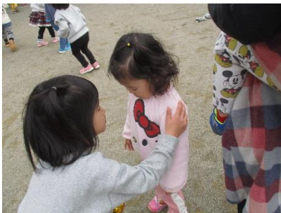
異年齢交流の成果。(^-)-☆