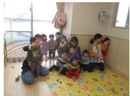
鬼が去って放心状態の子ども達 「もうなんなが〜っ!!!」