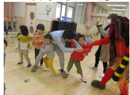
仕切り戸のお陰で隣のみかんに スムーズに入室。「ひええっ!」