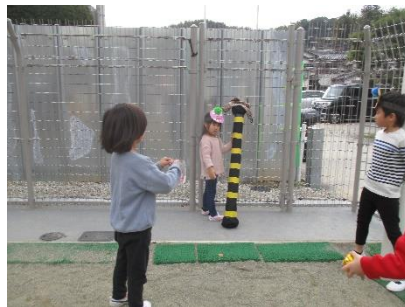
お約束。金棒のお忘れ物。