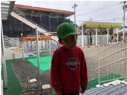
手紙を見ただけで全身硬直。 自分の身を案ずるお友達