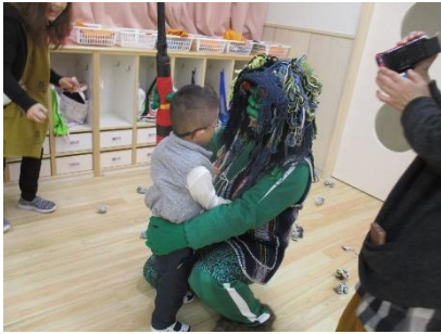
「まあ、話をしようじゃないか」 みかん組外務大臣が手腕を發揮