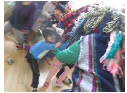
鬼は赤、青、緑系の服を着たお友達には 仲間と間違えて近づきます。(事後報告)