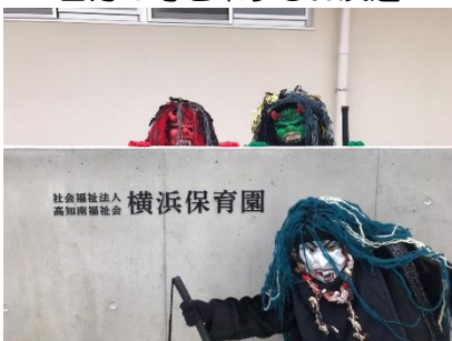
鬼さん来園。「新園舎落成 おめでとうございます。」