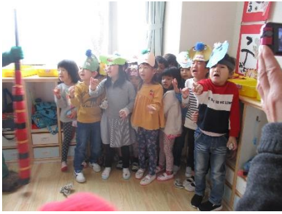
鬼「ぶどう組さん、おまち～」 子「おりこにしますう～」