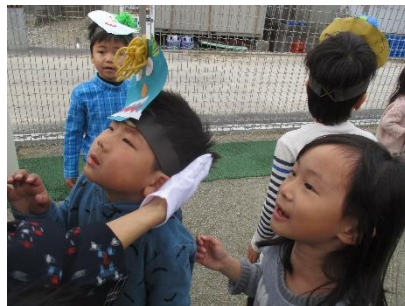
お福さんに必死で訴えるお友 達。「ん?ちょっと顔怖い…」