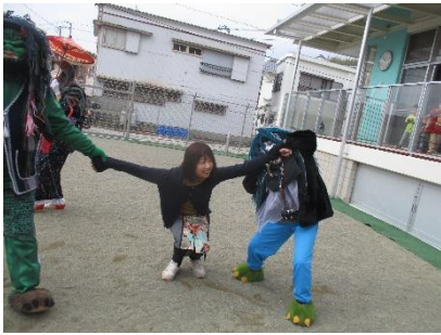
しかし、誰も助けに来ず…。 せんせー絶体絶命!!