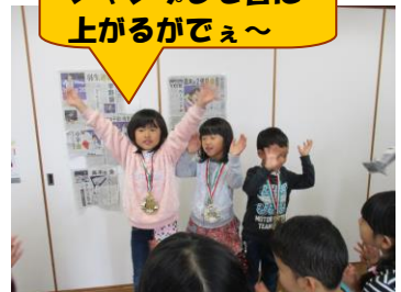
ジャンプして台に 上がるがでえ～