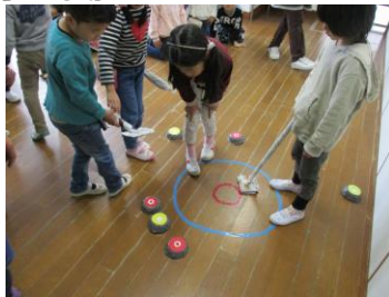
距離を慎重に見定めて