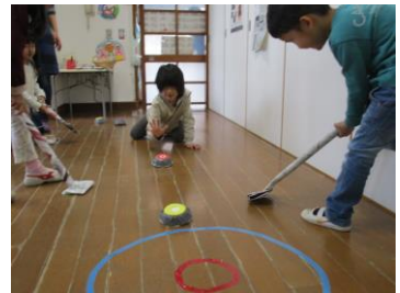
ちゃんとガードもできてる～