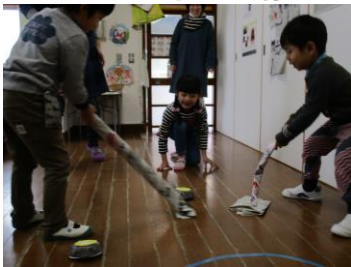
スウィープ! 石に触る反則行為も笑

「カーリングしたいがですけど、何かで作れますかねえ。」担任からの相談に試行錯誤した結果、深めの紙皿の中にゴルフボールを拝借して転がしてみたら、何となくそれらしいものができました(笑)子ども達には、「アイルランドのアルサグレイグ島でしか産出されない花崗岩で造った1セット160万円の高価なもの」と説明してあります。